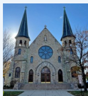
St. Mary Church / Iglesia de Santa Maria