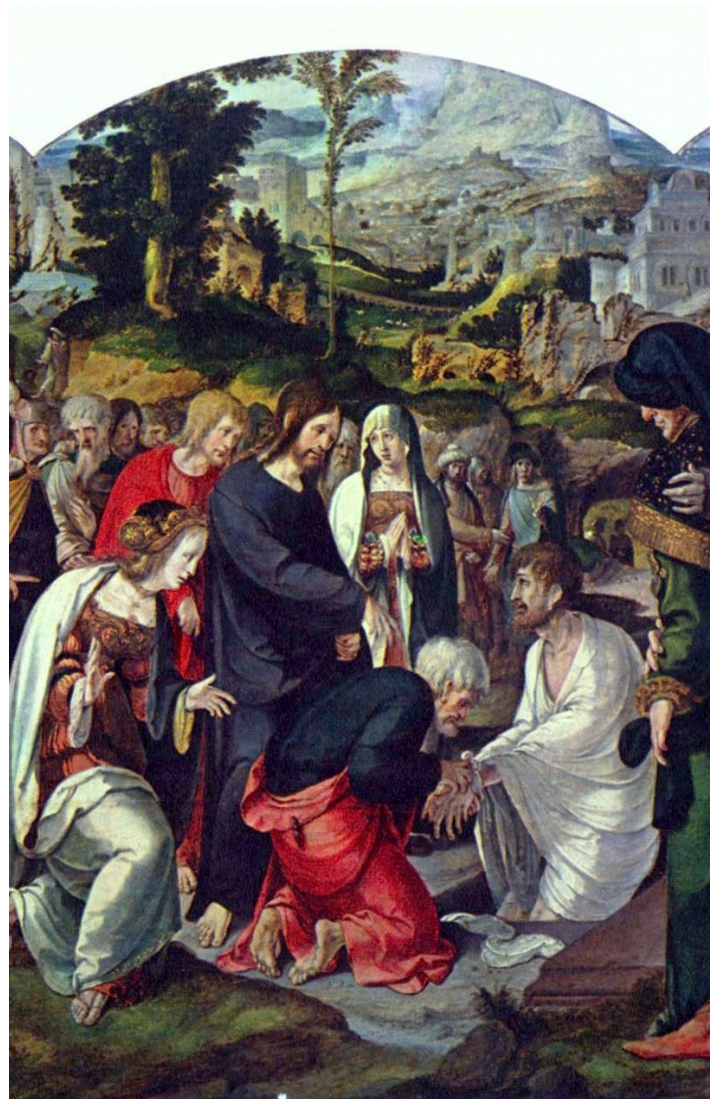
Aertgen Van Leyden, Rising of Lazarus (ca. 1525)