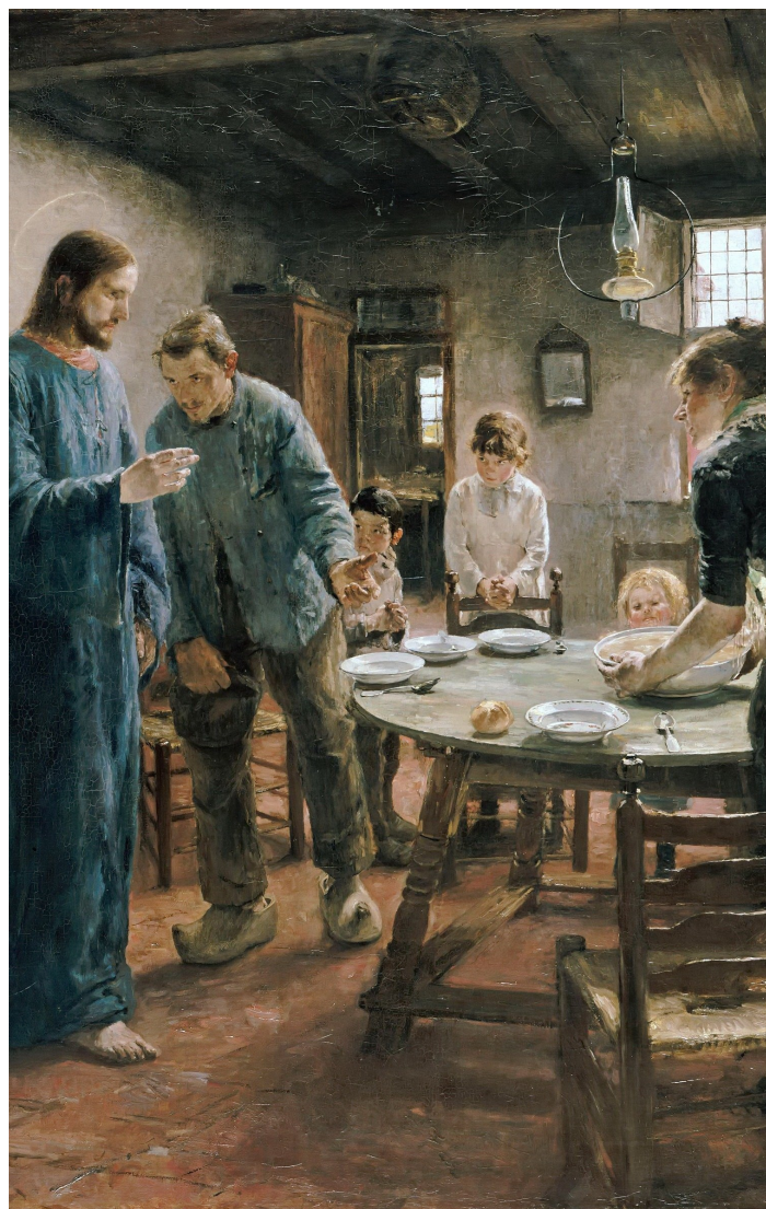
Fritz von Uhde, Mealtime Prayer (1848-1911)

¿Esperas un lugar de honor? ¿O ocupas humildemente un lugar más alejado del anfitrión? Cuando eres el anfitrión, ¿invitas a personas que pueden retribuirte de alguna manera: políticamente, económicamente o socialmente? Más bien, invita a personas que no tienen nada que darte; tiende la mano con auténtica humildad y amor para incluir a los que tienen poco o ningún sitio en la mesa.