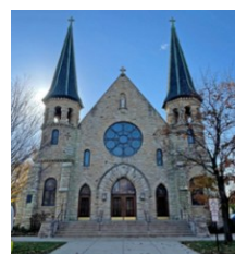
St. Mary Church / Iglesia de Santa Maria