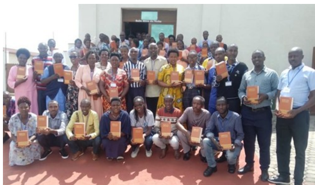
Líderes laicos con Biblias tras una sesión de formación de la Escuela de la Fe el año pasado

La colecta de la Cooperativa Misionera para la Diócesis de Kabgayi estará en todas las misas este domingo. El P. Deogratias celebrará las misas de 5 p.m., 8 a.m., 10:30 a.m., y 12:30 p.m.