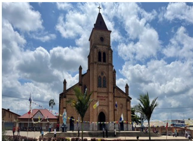
La Catedral Basílica de Nuestra Señora, catedral católica romana, basílica menor y sede de la diócesis de Kabgayi en Ruanda.