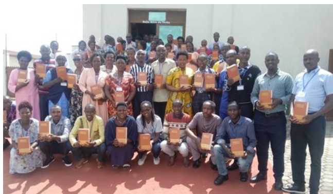
Lay leaders with Bibles after a School of Faith training session last year