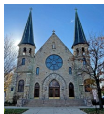
St. Mary Church / Iglesia de Santa Maria