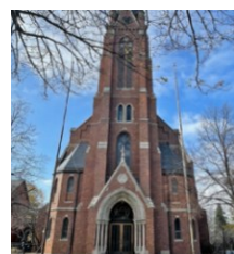
St. Nicholas Church / Iglesia de San Nicolás