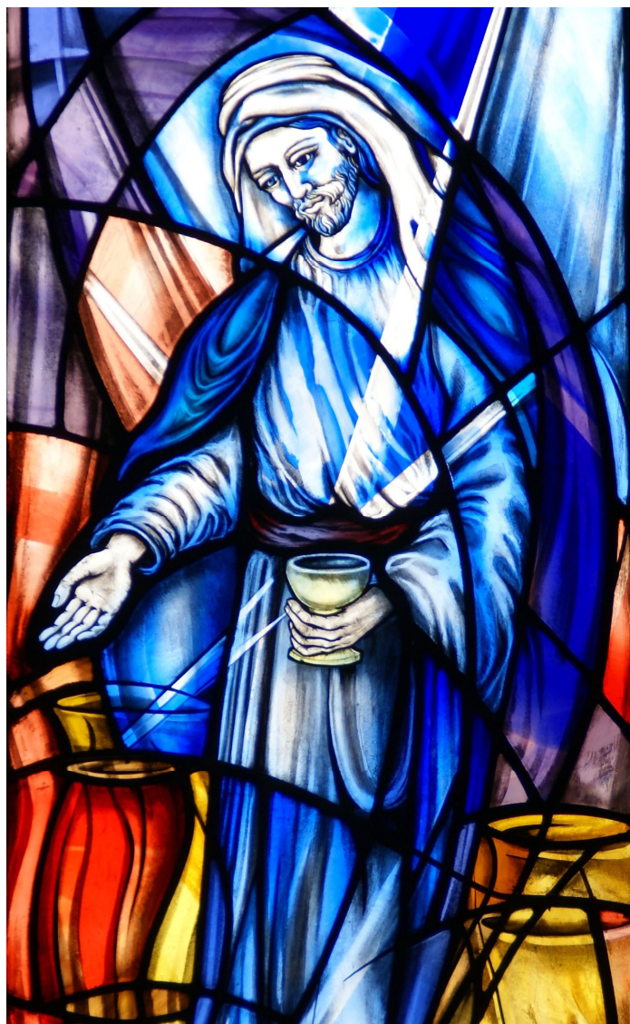
Anonymous, Water into Wine

Todo es cuestión de confianza. María planteó sus preocupaciones y luego confió en que su hijo actuaría. Los servidores sabían que el vino se había acabado, pero de todos modos llenaron las tinajas con agua. Sabían que las tinajas sólo contenían agua, pero de todos modos se las llevaron al anfitrión. Hicieron lo que podían hacer y luego confiaron. A cada uno de nosotros se nos han dado dones: haz lo que puedas con lo que tienes. El Señor se encargará a partir de ahí.