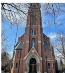
St. Nicholas Church / Iglesia de San Nicolás