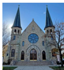
St. Mary Church / Iglesia de Santa Maria