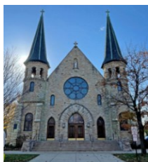
St. Mary Church / Iglesia de Santa Maria