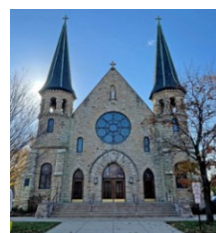
St. Mary Church / Iglesia de Santa Maria