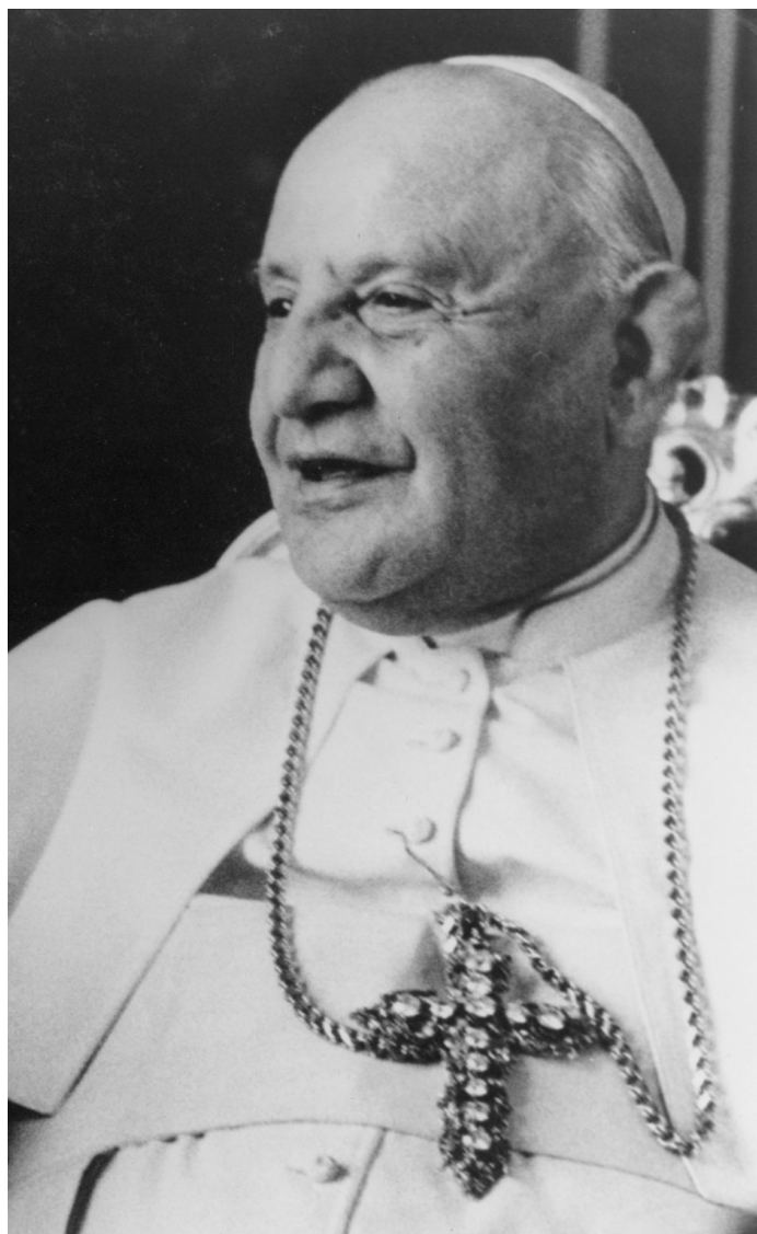
Pope John XXIII