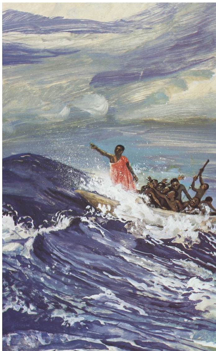
JESUS MAIFA, Jesus Calms the Storm (1973)

Jesús ya ha muerto una vez para siempre; todos hemos muerto con él en el bautismo y hemos resucitado a una nueva vida como nuevas creaciones y miembros del Cuerpo de Cristo, la Iglesia. Somos sus manos y sus pies, llamados a llevar su poder sanador al mundo para calmar estos tiempos tempestuosos.