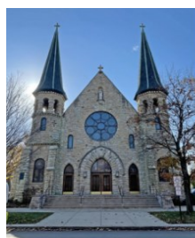
St. Mary Church / Iglesia de Santa Maria