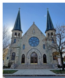
St. Mary Church / Iglesia de Santa Maria