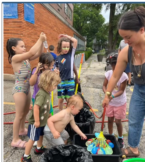
Water balloon fight at Family Fun Fridays at Pope John XXIII