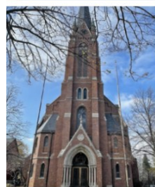
St. Nicholas Church / Iglesia de San Nicolás