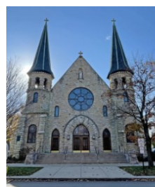
St. Mary Church / Iglesia de Santa Maria