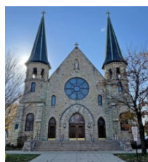
St. Mary Church / Iglesia de Santa Maria