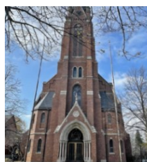
St. Nicholas Church / Iglesia de San Nicolás