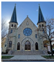
St. Mary Church / Iglesia de Santa Maria